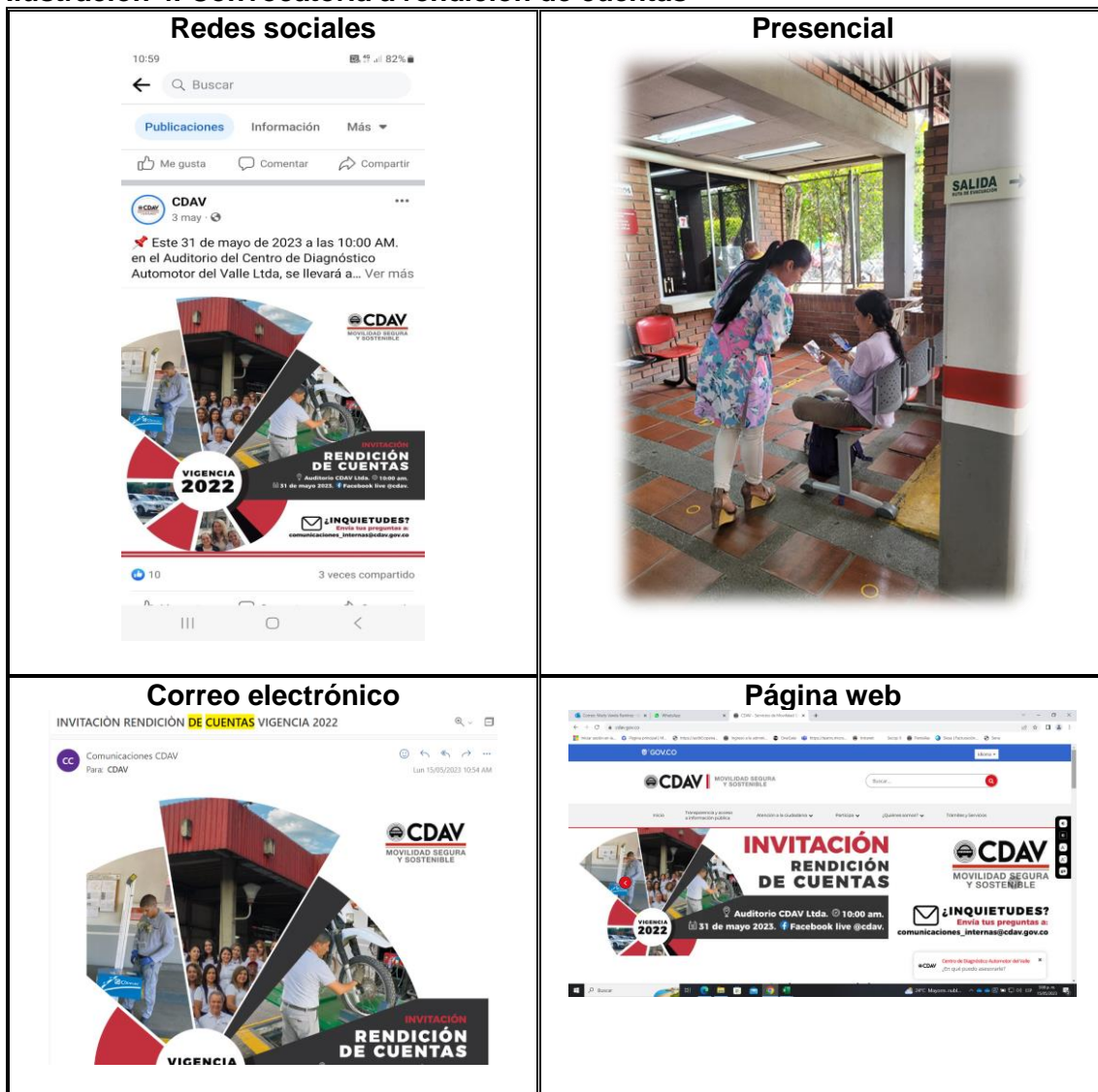
Ilustración 4. Convocatoria a rendición de cuentas