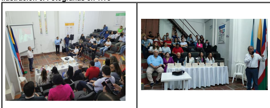
Ilustración 6. Fotografías en vivo