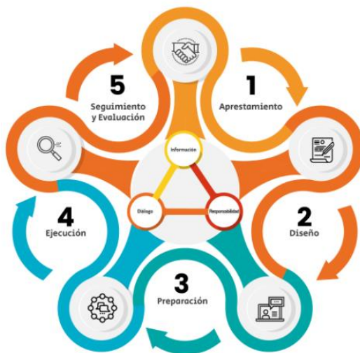
Ilustración 1 – Etapas rendición pública Manual Único de Rendición de Cuentas - MURC

Fuente de información: DAFP https://www.funcionpublica.gov.co/web/murc/cuales-son-las-etapas-del-proceso-de-la-rendicion-de-cuentas